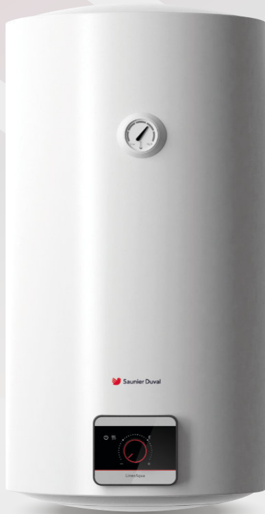
Modelos de 30 a 100 litros

La nueva gama de termos LineaAqua está especialmente diseñada para una fácil instalación y reposición, y una mayor durabilidad